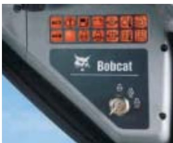
Cruscotto DESTRO di serie