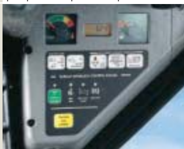
Cruscotto SINISTRO di serie

La strumentazione all'avanguardia offre decine di opzioni per il comando, la diagnostica e il controllo delle funzioni operative della macchina. Il cruscotto Deluxe opzionale è dotato di sistema antifurto d'avviamento senza chiave, sistema di bloccaggio delle funzioni, orologio e contatore digitale, monitor multilingue e perfino un menù di "aiuto".