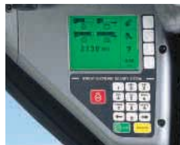
Cruscotto Deluxe OPZIONALE