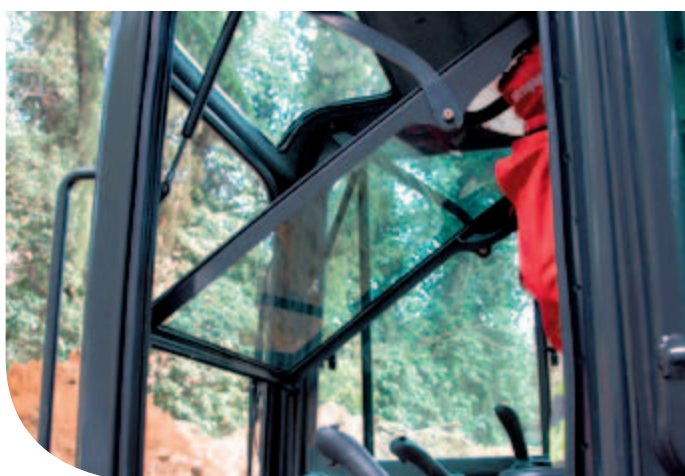
Migliorate la vostra prospettiva con la visibilità a 360° offerta da E32 e E35.

Un ambiente di lavoro confortevole ed efficiente permette di portare a termine con molta più facilità qualsiasi applicazione. Ecco perché il comfort dell'operatore è per noi una priorità. Caratteristiche come il nuovo motore e i nuovi sistemi di aspirazione aria, di raffreddamento e di scarico dell'E32 e dell'E35 riducono le vibrazioni, il calore e la rumorosità. Il design della cabina offre invece più spazio, più visibilità e più comfort complessivo.