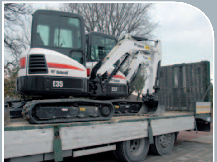
Compatto e facile da trasportare!