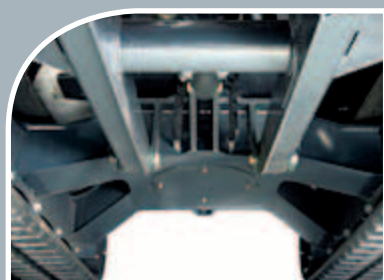
Il nuovo sottocarro a "X" aumenta l'altezza minima da terra e favorisce il distacco dei detriti eventualmente accumulatisi.

Il pulsante sul joystick sinistro azionabile con il pollice ① offre un triplice vantaggio rispetto al classico pedale: controllo preciso del brandeggio del braccio; ergonomia migliorata; più spazio sul fondo della cabina (e per le gambe dell'operatore!)