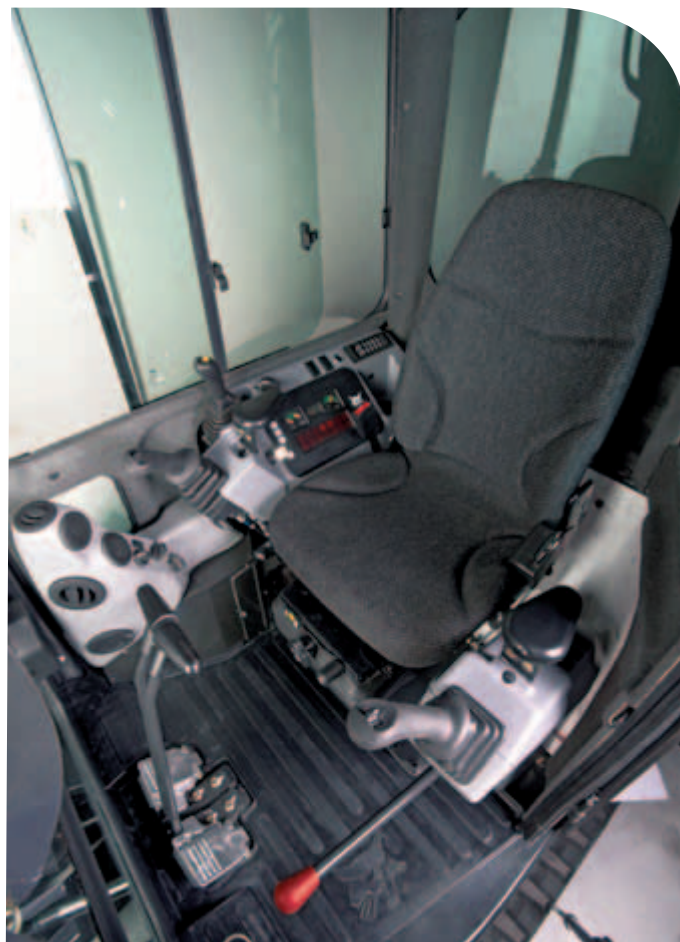
La cabina straordinariamente spaziosa è concepita in ogni sua parte ponendo il comfort dell'operatore al primo posto.