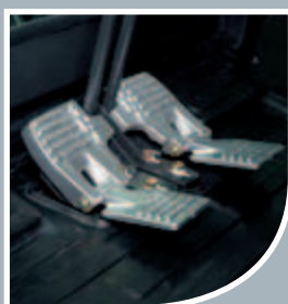
I nuovi pedali di traslazione ergonomici in alluminio fuso assicurano un controllo fluido e sicuro durante la guida della macchina.